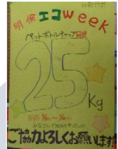
エコキャップ回収 ＜明倫中学校＞