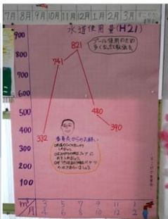
水使用量のグラフ ＜殿下幼小中学校＞

今年度は、平成18年度に参加し「環境にやさしい学校」として認定され、更新を向かえる18校の中から、下記の学校を選定し訪問しました。学校へは、FEPS委員と市職員とで訪問し、取組を確認しました。（取組の様子は、各学校のHP等をご覧ください）