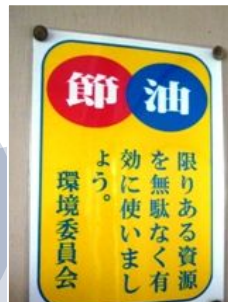
啓発ポスター ＜藤島中学校＞