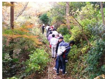
「里山に親しむ」 (足羽山) (09.11.28)