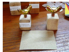
科学的 おもちゃ づくり