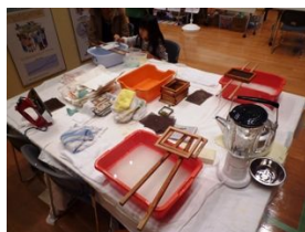
牛乳 パック 紙すき