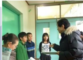
生徒へのインタビュー ＜松本小学校＞