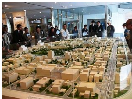
「バスで行く！ 環境モデル都市 富山市」 (09.11.8)

セミナーは自然観察会、学習会や体験学習など様々なテーマで企画し、また子どもだけでなく大人も楽しんで学べる内容です。