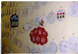
我が家の節約術 ＜宝永小学校＞